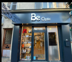
BE-OPTIC 25 RUE MAURICE THOREZ 92000 NANTERRE

Je possède deux magasins dans les hauts-de-seine, un à Nanterre et un autre à Neuilly-sur-seine. Ces boutiques commercialisent un large choix de marques pour offrir à notre clientèle un panel divers et varié de lunettes.