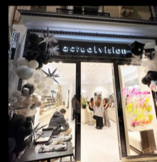
ACTUAL VISION 38 RUE DE SABLONVILLE 92200 NEUILLY-SUR-SEINE